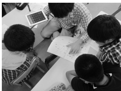
図2 シミュレーションの様子

2班は男子生徒であるGとHが、きちんと考えながらシミュレーションに取り組んでいた。また、女子生徒のEとFも楽しみながらシミュレーション活動ができていた。だが、それでもミッション2の途中までしか進まなかったため、そもそもシミュレーションに充てた時間が少なかったと思われる。今回は約40分をシミュレーションに充てたが、60分程度の時間を確保できていたら、全てのミッションが余裕をもって完了できたのではないかと授業者は考えた。