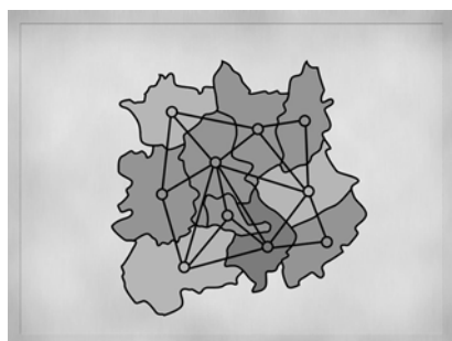
図4 四色定理の証明を説明したスライド 41

の間、生徒は小池の方を見て、興味深そうに聞いていた。具体的な例を出して説明したことにより、生徒の関心が深まったのではないかと考えられる。